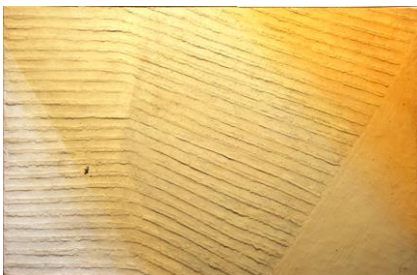
Septembre I - relief, 1971 Résine sur bois, 136 x 207 cm.

De la photographie aux œuvres sur papier. Raoul Ubac, se consacre tout d'abord à la photographie d'esprit surréaliste qu'il expose dès 1933. Il publie notamment dans la revue Minotaure , et André Breton lui commande en 1938 la photographie des mannequins présentée à l'Exposition Internationale du Surréalisme qui a lieu en 1947 à la Galerie Maeght. Il délaisse peu à peu la photographie au milieu des années 1940. Loin d'une véritable rupture, sa passion pour les minéraux qu'il photographiait déjà annonce son intérêt pour l'ardoise et s'inscrit dans les recherches sur les formes minérales auxquelles participent Brassai, Eileen Agar ou encore Raoul Hausmann. Ses nouvelles amitiés parisiennes, parmi lesquelles celles d'André Frénaud, Jean Lescure ou Alain Trutat, lui ouvrent de nouveaux horizons. Raoul Ubac s'affirme de plus en plus par le dessin, réaliste et à l'encre.