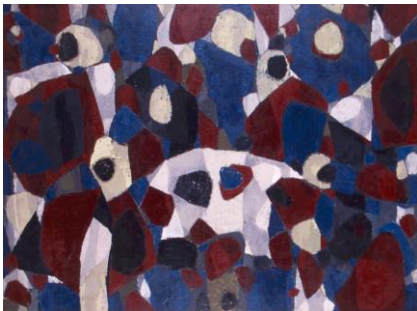
Tohu va bohu - Bee bop, 1955 Huile sur toile, 97 x 130 cm.