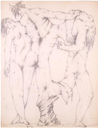
Métamorphose, 1940 Crayon sur papier, 31,5 x 24,5 cm.

« Un homme merveilleux, honnête, un artiste exemplaire comme beaucoup de sa génération », selon les mots d'Adrien Maeght.