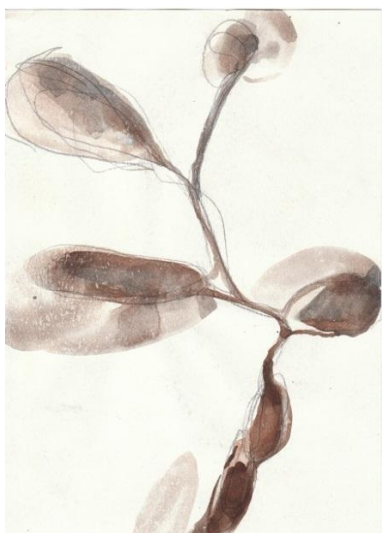
Luc Doerflinger, Ondulor , 2008. Crayon et aquarelle sur papier. 22,5 x 15,8 cm.