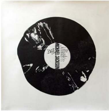
Stéphanie Jager . Vinyl-Bad, 2009. Graphite sur papier. 150 x 150 cm.