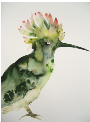
Cécile Granier de Cassagnac, Oiseau barbot , 2008. Aquarelle sur papier. 76 x 58 cm.