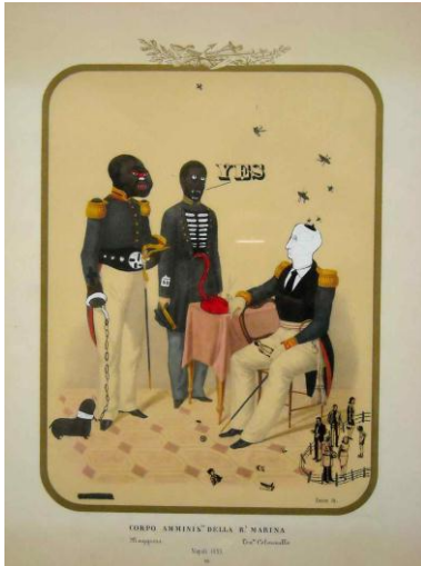
Miguel Valdivia , Incônes d'un nouvel ordre mondial , 2008. Technique mixte sur estampe. 32 x 43 cm.