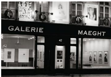
La Galerie Maeght de Paris, rue du Bac